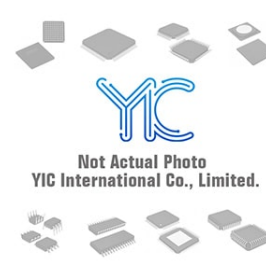
IRF9333 IR IRF9333 IR