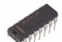
MAX944CPD Maxim Integrated IC COMPARATOR QUAD R-R LP 14-DIP