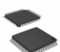
PIC16C662T-20I/PT Microchip Technology IC MCU 8BIT 7KB OTP 44TQFP