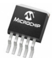
MCP1825-5002E/ET Microchip Technology IC REG LDO 5V 0.5A DDPK