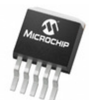
MCP1825-ADJE/ET Microchip Technology IC REG LDO ADJ 0.5A DDPK