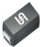
ES2DA M2G TSC (Taiwan Semiconductor) DIODE GEN PURP 200V 2A DO214AC