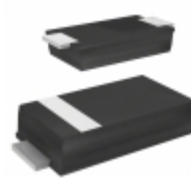
ES2DAF AMI Semiconductor / ON Semiconductor DIODE GEN PURP 200V 2A DO214AD