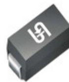
ES2DAH2M2G TSC (Taiwan Semiconductor) DIODE GEN PURP 200V 2A DO214AC