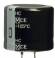
EET-HC2G221DA Panasonic Electronic Components CAP ALUM 220UF 20% 400V SNAP