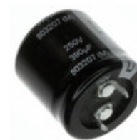
EET-HC2G271CA Panasonic Electronic Components CAP ALUM 270UF 20% 400V SNAP