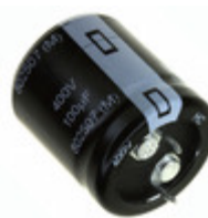
EET-HC2G221HA Panasonic Electronic Components CAP ALUM 220UF 20% 400V SNAP