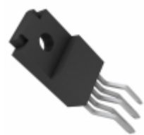
BA033CC0WT-V5 Rohm Semiconductor IC REG LDO 3.3V 1A TO-220FP