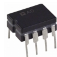
AD829SQ Analog Devices Inc. IC VIDEO OPAMP HS LN 8-CDIP