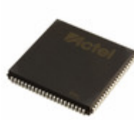
A42MX16-FPL84 Microsemi Corporation IC FPGA 72 I/O 84PLCC