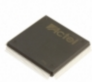
A42MX16-FPQ160 Microsemi Corporation IC FPGA 125 I/O 160QFP