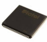
A42MX16-FPLG84 Microsemi Corporation IC FPGA 72 I/O 84PLCC