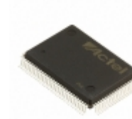
A42MX16-FPQ100 Microsemi Corporation IC FPGA 83 I/O 100QFP