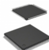
A42MX16-3VQG100 Microsemi Corporation IC FPGA 83 I/O 100VQFP