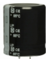
ECE-S2GP471EX Panasonic Electronic Components CAP ALUM 470UF 20% 400V SNAP