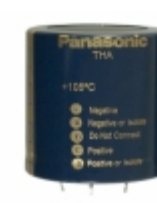
ECE-T1CA563EA Panasonic Electronic Components CAP ALUM 56000UF 20% 16V SNAP