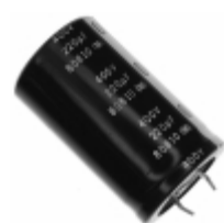
ECE-S2GG221U Panasonic Electronic Components CAP ALUM 220UF 20% 400V SNAP