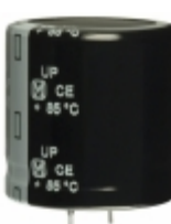
ECE-S2WP331EX Panasonic Electronic Components CAP ALUM 330UF 20% 450V SNAP