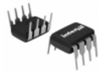
ISL83485IP Intersil IC TXRX RS485/422 3.3V LP 8-D