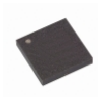
AT17C65-10CI Microchip Technology IC SRL CONFIG EEPROM 64K 8LAP