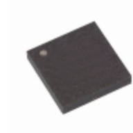
AT17C65-10CC Microchip Technology IC SRL CONFIG EEPROM 64K 8LAP