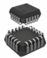
AT17C512A-10JI Microchip Technology IC SER CONFIG PROM 512K 20PLCC