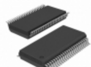
STK17T88-RF45ITR Cypress Semiconductor Corp IC NVSRAM 256KBIT 45NS 48SSOP