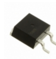
IXTA1R6N100D2HV IXYS Corporation MOSFET N-CH