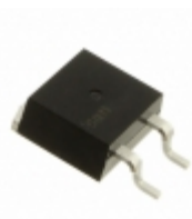
IXTA1N170DHV IXYS MOSFET N-CH 1700V 1A TO-263