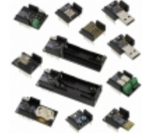
RFD90104 RF Digital Corporation RFDUINO MULTI PROJECT DEV KIT