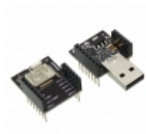
RFD90101 RF Digital Corporation RFDUINO TEASER KIT