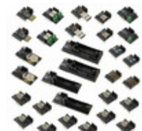
RFD90105 RF Digital Corporation RFDUINO MASTER DEV KIT