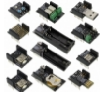
RFD90103 RF Digital Corporation RFDUINO EXPERIMENTERS DEV KIT