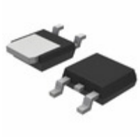
NCV8774DT33RKG ON Semiconductor IC REG LDO 3.3V 0.35A