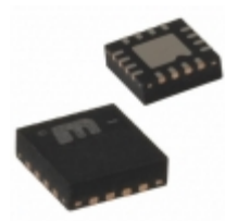
MIC2213-AAFML-TR Microchip Technology IC REG LDO ADJ 0.15A/0.3A 16MLF