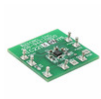
MIC2213-GNYML-EV Micrel / Microchip Technology EVAL BOARD ADJ SEQ POWER