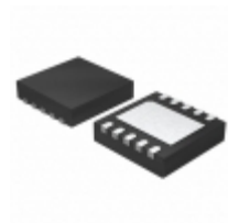
MIC2213-GSYML-TR Microchip Technology IC REG LDO 1.8V/3.3V 10MLF