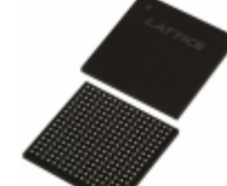
LC4256V-5FTN256BI Lattice Semiconductor Corporation IC CPLD 256MC 5NS 256FTBGA