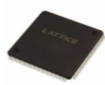
LC4256V-5T176I Lattice Semiconductor Corporation IC CPLD 256MC 5NS 176TQFP