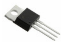
ISL9V5036P3_F085 Fairchild/ON Semiconductor IGBT 390V 46A 250W TO220AA-3