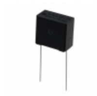
ECQ-UAAF334K Panasonic Electronic Components CAP FILM 0.33UF 10% 275VAC RAD