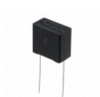
ECQ-UAAF334M Panasonic Electronic Components CAP FILM 0.33UF 20% 275VAC RAD