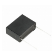
ECQ-UAAF335MA Panasonic METALLIZED POLYPROPYLENE FILM CA