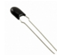
ERZ-VA7V680 Panasonic Electronic Components VARISTOR 68V 500A DISC 7MM