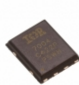
IRFH7004TRPBF Infineon Technologies MOSFET N CH 40V 100A PQFN 5X6