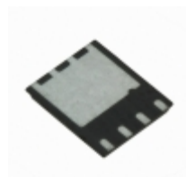
IRFH6200TRPBF Infineon Technologies MOSFET N-CH 20V 45A 8-PQFN