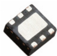
MCP14A0151T-E/MAY Microchip Technology IC MOSFET DVR 1.5A SINGLE 2X2 QF