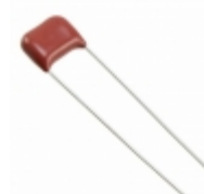
ECQ-E4223JF Panasonic Electronic Components CAP FILM 0.022UF 5% 400VDC RAD