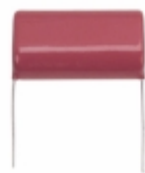
ECQ-E4185KZ Panasonic Electronic Components CAP FILM 1.8UF 10% 400VDC RADIAL