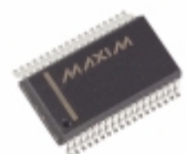
MAX6956AAX+T Maxim Integrated IC DRVR DSPL LED 36-SSOP