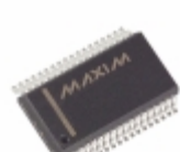
MAX6956AAX+ Maxim Integrated IC DRVR DSPL LED 36-SSOP