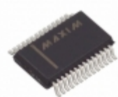
MAX6956AAI+ Maxim Integrated IC DRIVER LED PORT 20/28 28-SSOP