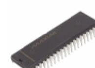
MAX6955APL+ Maxim Integrated IC DRIVER LED SEG 14/16 40-DIP