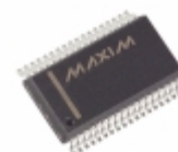
MAX6955AAX+ Maxim Integrated IC DRIVER LED SEG 14/16 36-SSOP