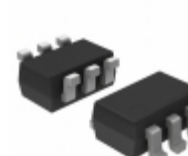
74LVC2G06GW-Q100H Nexperia USA Inc. IC INVERTER O-D OUTPUT 6TSSOP