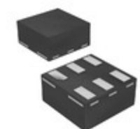
74LVC2G06GS,132 Nexperia USA Inc. IC INVERTER OPEN-DRAIN 6XSON