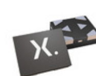
74LVC2G06GXZ Nexperia 74LVC2G06GX/SOT1255/X2SON6