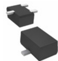
UNR511V00L Panasonic Electronic Components TRANS PREBIAS PNP 150MW SMINI3