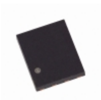
AT24C1024Y4-10YU-2.7 Microchip Technology IC EEPROM 1MBIT 1MHZ 8SAP