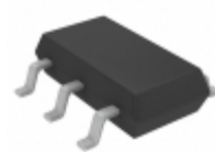
LT3462ES6#TRMPBF ADI (Analog Devices, Inc.) IC REG CUK INV ADJ 0.25A TSOT23