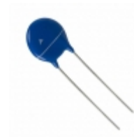
B72214T2211K101 EPCOS (TDK) VARISTOR 330V 6KA 3SIP