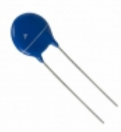
B72214S681K331 EPCOS (TDK) VARISTOR 1100V 4.5KA DISC 14MM