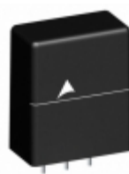
B72214T2171K105 EPCOS (TDK) VARISTOR 270V 6KA 3SIP