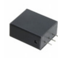
B72214T2151K101 EPCOS VARISTOR 240V 6KA RADIAL