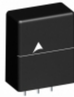
B72214T2151K105 EPCOS (TDK) VARISTOR 240V 6KA 3SIP