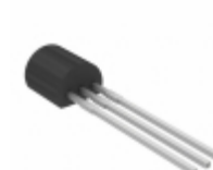
BUJ100LR,412 WeEn Semiconductors TRANS NPN 400V 1A TO-92