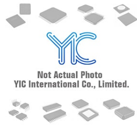
BUJ105AB PHILIPS BUJ105AB PHILIPS