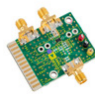
AD8319-EVALZ Analog Devices Inc. BOARD EVAL FOR AD8319