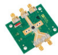
AD8318-EP-EVALZ Analog Devices Inc. EVAL BOARD FOR AD8318