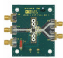
AD8318-EVALZ Analog Devices Inc. BOARD EVAL FOR AD8318