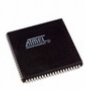
ATF1508AS-7JX84 Microchip Technology IC CPLD 128MC 7.5NS 84PLCC