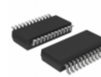
LTC1279CG#TRPBF Linear Technology IC A/D CONV SAMPLNG W/SHTDN24SSOP