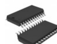
LTC1278-5CSW#TRPBF ADI (Analog Devices, Inc.) IC A/D CONV SAMPLNG W/SHTDN24SOIC