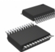
MIC2564A-1YSM-TR Microchip Technology IC PCMCIA/CARDBUS DUAL 24-SSOP