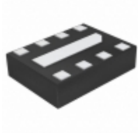
MIC5399-SSYMX-T5 Microchip Technology IC REG LDO DUAL 3.3V 8DFN