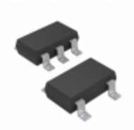
MIC5318-2.85YD5-TR Microchip Technology IC REG LDO 2.85V 0.3A TSOT23-5