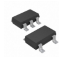
MIC5318-2.6YD5-TR Microchip Technology IC REG LDO 2.6V 0.3A TSOT23-5