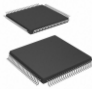
AT40K05-2AQI Microchip Technology IC FPGA 78 I/O 100TQFP