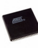
AT40K05-2AJI Microchip Technology IC FPGA 62 I/O 84PLCC