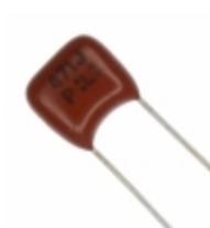
ECQ-P1H471JZ Panasonic Electronic Components CAP FILM 470PF 5% 50VDC RADIAL