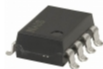
AQW210TSX Panasonic RELAY OPTO SPST 120MA 8 SOP