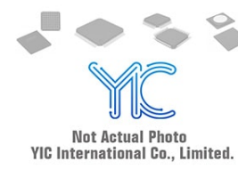
AQW212EHAXE88 PANASON PANASON SOP-8