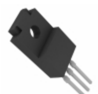
BA06T Rohm Semiconductor IC REG LDO 6V 1A TO-220FP