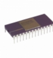
AD676KDZ Analog Devices Inc. IC ADC 16BIT SAMPLING 28- CDIP