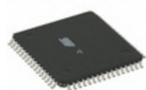
ATMEGA645A-AU Microchip Technology IC MCU 8BIT 64KB FLASH 64TQFP