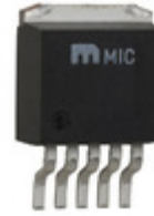
MIC5209-2.5YU Microchip Technology IC REG LDO 2.5V 0.5A TO263-5