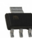
MIC5209-2.5YS-TR Microchip Technology IC REG LDO 2.5V 0.5A SOT223