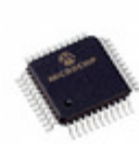
PIC16LC74A-04I/PQ Microchip Technology IC MCU 8BIT 7KB OTP 44MQFP