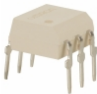
G3VM-3L Omron Electronics Inc-EMC Div RELAY SSR SPST-NO 350VAC 6DIP