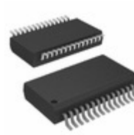
ENC28J60-I/SS Microchip Technology IC ETHERNET CTRLR W/SPI 28SSOP