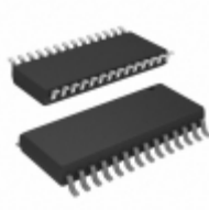
ENC28J60/SO Microchip Technology IC ETHERNET CTRLR W/SPI 28SOIC