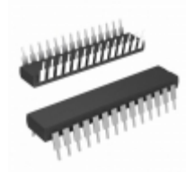
ENC28J60/SP Microchip Technology IC ETHERNET CTRLR W/SPI 28SDIP