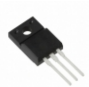
2SB0940AP Panasonic Electronic Components TRANS PNP 180V 2A TO-220F