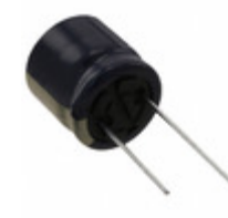
EEU-FC1C152SB Panasonic Electronic Components CAP ALUM 1500UF 20% 16V RADIAL