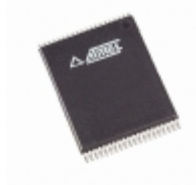
AT27BV1024-12VC Microchip Technology IC OTP 1MBIT 120NS 40VSOP