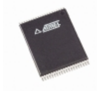
AT27BV1024-15VC Microchip Technology IC OTP 1MBIT 150NS 40VSOP